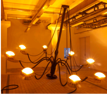
Kristof Kintera, My Light Is Your Light . Vue de l'exposition "Analysis Results", Kristof Kintera, La Station, Nice, 2012